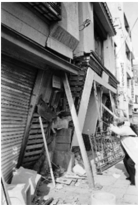
阪神淡路大震災での被災住宅