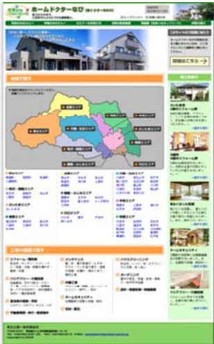
地域別、工種別で検索できる仕組みになっている。